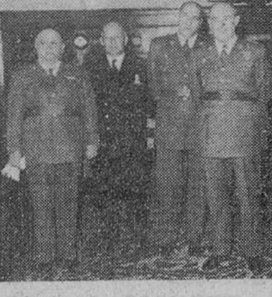
La Coruña. — El Príncipe D. Juan Carlos de Borbón durante su visita de cumplimiento al capitán general de la VIII Región Militar, con motivo de su próxima incorporación a la Escuela Naval de Marín.

El Príncipe Don Juan Carlos de Borbón, en La Coruña