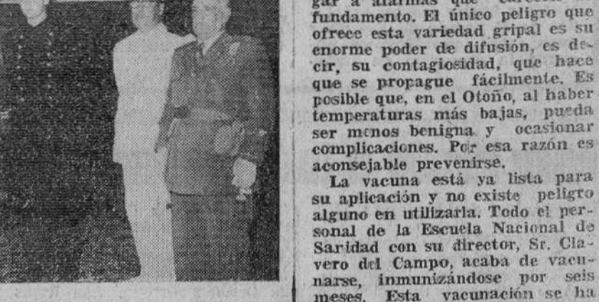
La Coruña. — El Príncipe D. Juan Carlos de Borbón durante su visita de cumplimiento al capitán general de la VIII Región Militar, con motivo de su próxima incorporación a la Escuela Naval de Marín.

El Príncipe Don Juan Carlos de Borbón, en La Coruña