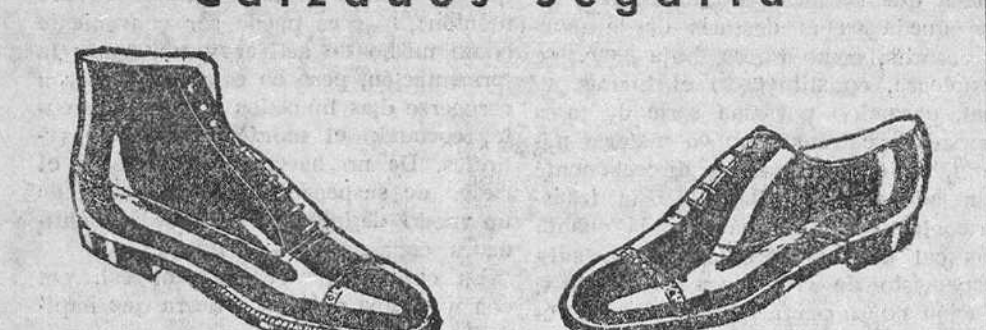
BOTAS Todo cosido a 19.50 pesetas ZAPATOS Los mejores—Últimos modelos a 13 pesetas