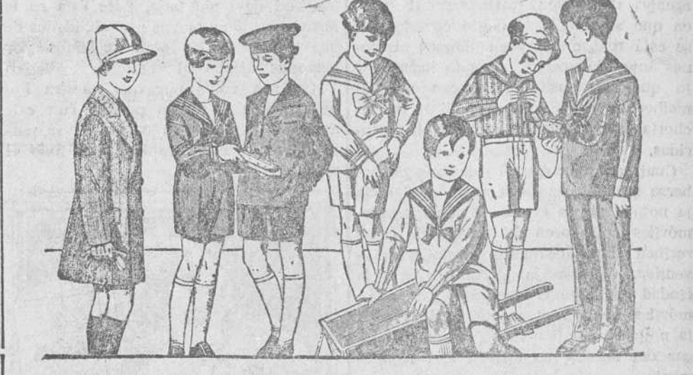
Trajecitos modelos novedad, de 15 a 40 pesetas.—La casa que más surtido presenta y más barato vende. Abrigos impermeables piel de elefante, valor 125 pesetas, hoy a 30. Aproveche esta ocasión única.