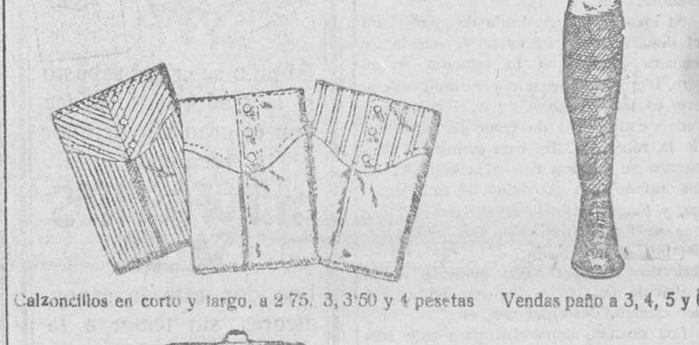
Calzoncillos en corto y largo, a 2 75, 3, 3 50 y 4 pesetas Vendas paño a 3, 4, 5 y 8