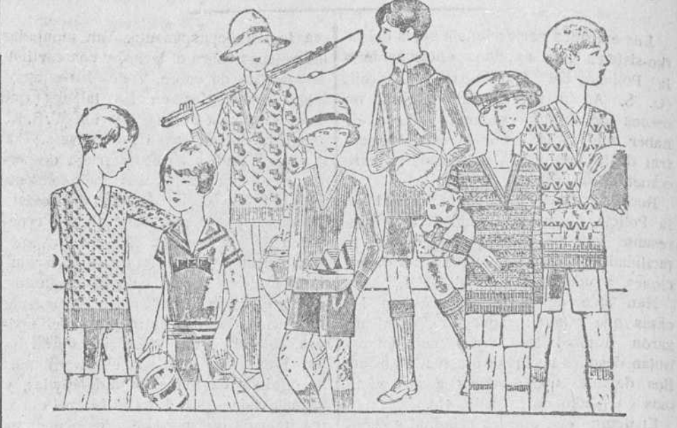
Terseys de lana o algodón, dibujos y Pantaloncitos cortos, en paño, pana o colores novedad, de 3,50 a 10 ptas. drid, de 3 a 7 pesetas uno