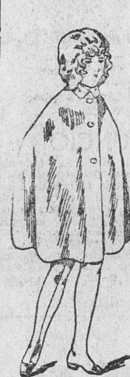
Capas colegiales, en distintos colores, a 8, 9, 10, 12 y 15 pesetas

Establecimiento oficial del Turing Club Español