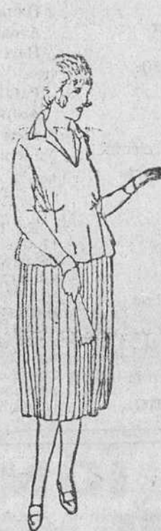
Ve tidos para jovencitos en crepe o lana, a 5, 20 y 25 pesetas