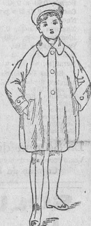
Impermeables, checos, a 18, 20, 25 y 35 pesetas