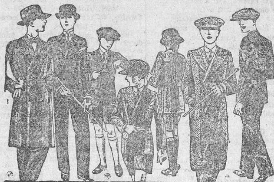
Trajes para jovencitos, edad de 12 a 20 años, a 40, 50, 60, 70 y 80 ptas.

Plaza Mayor, 42, Lain-Calvo, 9 y 11.—Sucursal: Plaza Mayor, 8, Burgos