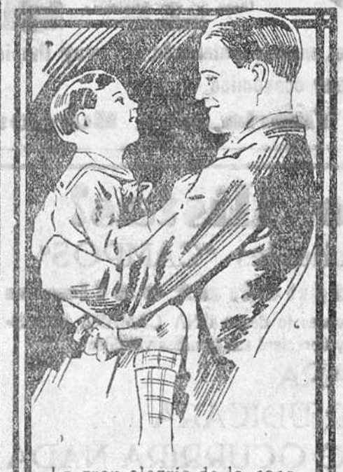
La gran alegría de la casa es ver al niño sano, fuerte y colorado.

El famoso Jarabe de HIPOFOSFITOS SALUD vivifica su sangre, facilita su normal desarrollo y le libra de INAPETENCIA DEBILIDAD TUBERCULOSIS RAQUITISMO Se toma en todo tiempo. Aprobado por la Academia de Medicina. No se vende a granel.