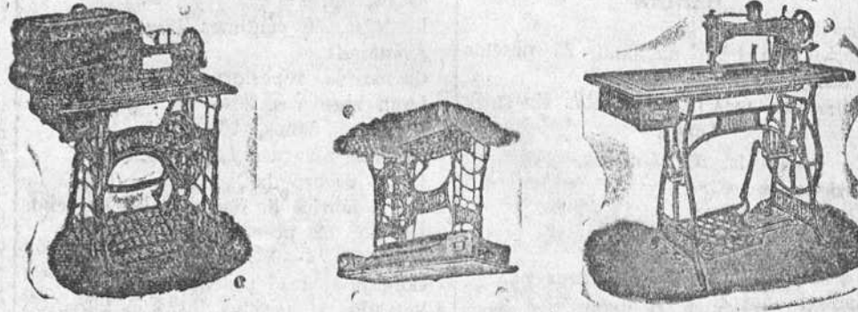
Máquina doméstica, cose hacia adelante y hacia atrás. 250 pesetas. Máquina secreter, de lanzadera vibrante, a 325 pesetas. De bobina central 395 pts. Máquina industrial, fuerte y silenciosa a 400 pesetas. Bobina central

La mejor y más barata de las máquinas de coser y máquinas de hacer medias y calcetines, es sin duda alguna la marca STOEWER (alemanas).