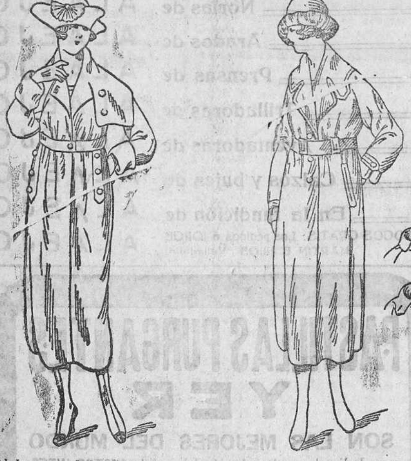
Abrigos novedad, en gamuzas, desde 55 á 150 pts. Gabardinas señora, desde 100 á 140 pts.

Primera casa en confecciones de caballero, señora, niños y niñas