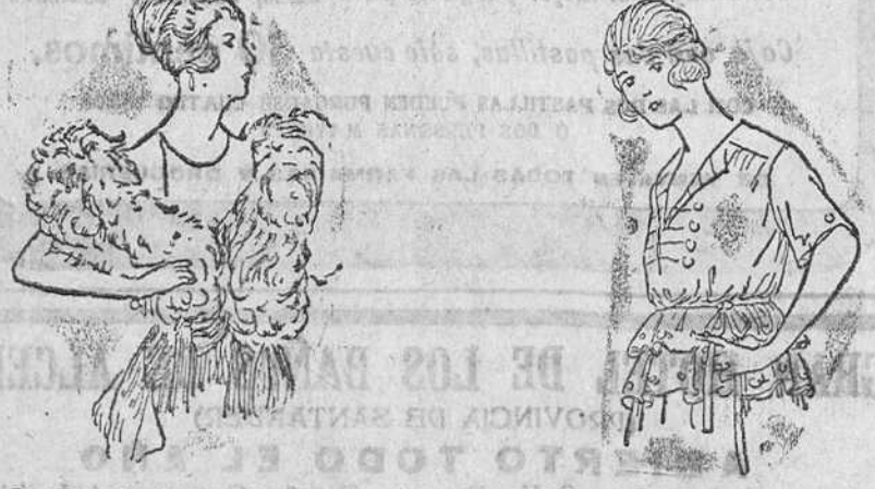
Cuellos de pluma -Salido- desde 25 á 65 pts. Jerseys lana, en colores novedad, á 15, 18, 20 y 25 pts.