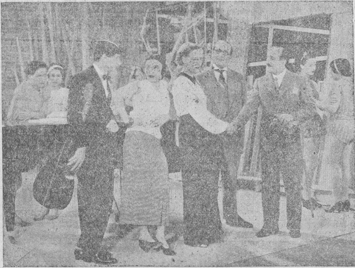
Una escena de NOCHES DE BUENOS AIRES, producción de Cifesa que presenta en la actual temporada

Benito Perojo es casado y tiene una hija de corta edad.