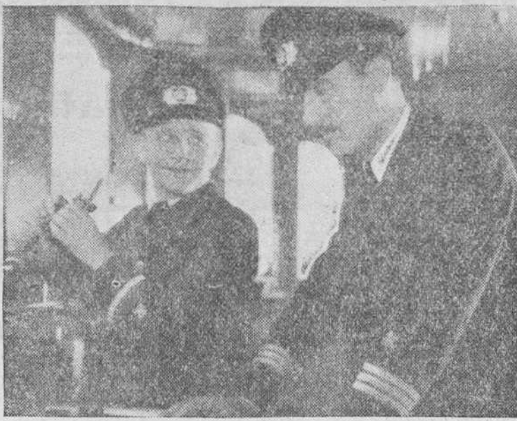
Una escena de la producción Cifesa NO ME OLVIDES que protagonizan el tenor Benjamino Gigli y Magda Schneider

Sus aventuras tienen por escenario la India Inglesa, llena de superstición y misterio. Pero ellos se burlan al final de todo para provocar la risa a raudales, sobre todo cuando se apoderan del enemigo sin hacer uso de las armas, porque han puesto en fuga una verdadera legión de abejas que estaban tranquilamente en sus panales.