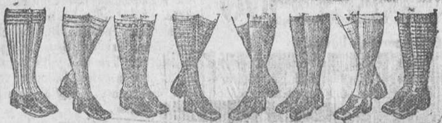
Medias sport, dibujos novedad, a 1, 1'50, 2, 2'50, 3 y 4 pesetas

TRAJES para mocetes todos los gustos, edad de 10 a 16 años a 30, 40 50 60 y 70 pesetas. TRAJES, pantalón nokel, desde 35 a 75 pesetas.