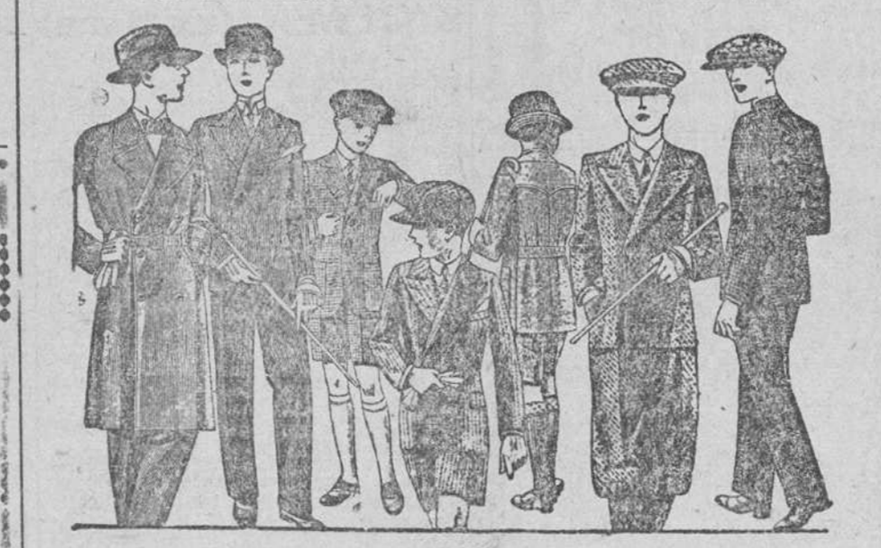
TRAJES Y TRINCHERAS para jovencitos de 10 a 18 años, en diferentes modelos, de paño, dril y lanilla de 25, 30, 35, 40, 50 y 60 pesetas Confección fina y esmerada / Sastrería y pañería / Corte moderno Siempre grandes existencias encontradas

Casa Munguia Plaza Mayor, 42, y Lala-Calvo, 9 y 11.-BURGOS