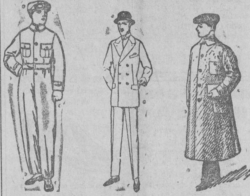
Buzos azules, color kaki y blancos, a 8, 10 y 15 ps. Trajes de confección fina, a 50, 60, 70 y 90 ps. Guardapolvos en color gris y kaki, de 7 a 20 ps. La casa que más surtido presenta y la que más barato vende.

Siempre grandes existencias encontrarán en la Casa Munguía Plaza Mayor, 42, y Lain-Calvo, 9 y 11--BURGOS