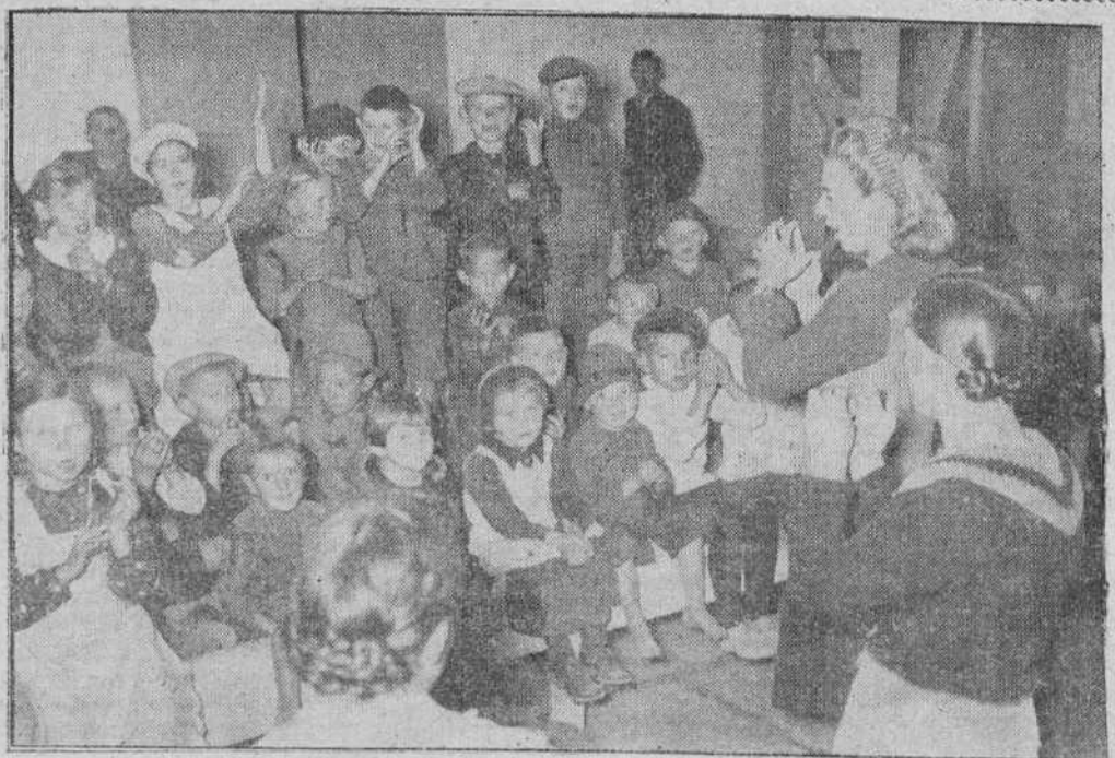
LAS GRANDES MIGRACIONES DE LA HISTORIA

Por amor a España. Por amor hacia las muchas criaturas que su fren hoy los rigores de una estructura injusta de la vida. Por el resurgir pujante de todos los sectores de la Patria Y, finalmente, por que a las órdenes de nuestro invicto Caudillo, cumplamos el mandato imperioso que nos ha legado lo más florido de la juventud que se nos fué en esta pasada contienda.