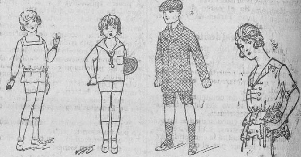
Trajecitos punto, desde 12 a 30 pesetas. Trajecitos punto seda, de 25 a 50 pesetas. Trajecito a cuadros blanco y negro, de 25 a 35 pesetas. Blusas punto seda, a 30, 35, 40 y 50 pesetas.

Precio fijo verdad. Todos los artículos marcados.