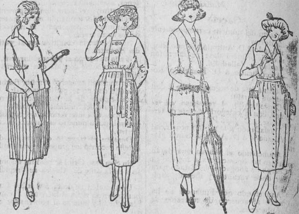
Gerseys seda, 25, 30 y 35 y 40 pts. Falda plisada, lana, 25, 30 y 35 pesetas. Diversos modelos de vestidos en lana, seda y algodón, desde lo más barato al artículo más caro.

Gran casa de tejidos, pañería y confecciones de caballero, señora y niños