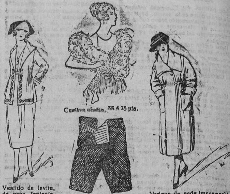
Cuellos blancos, 55 á 75 pts.

Gran bazar de ropas con seccionadas de caballero, señora y niñas