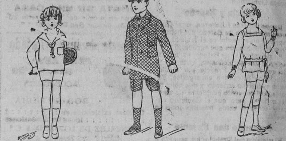
Trajecito de punto, diferentes colores; desde 9 m á 20 pesetas