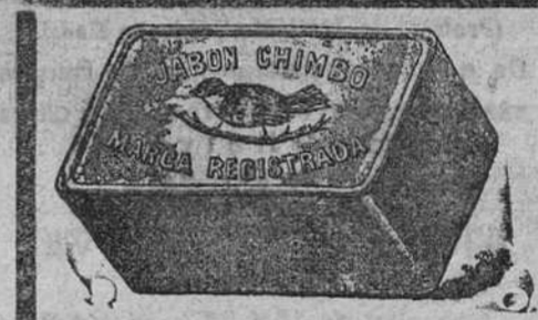
ANTIGUA JABONERA TAPIA Y SOBRINO S. A.—BILBAO

El tiempo nos demostró que todo otro procedimiento de lavado que no sea con buen jabón, destruye la ropa. El uso nos está demostrando que el mejor jabón es el CHIMBO.