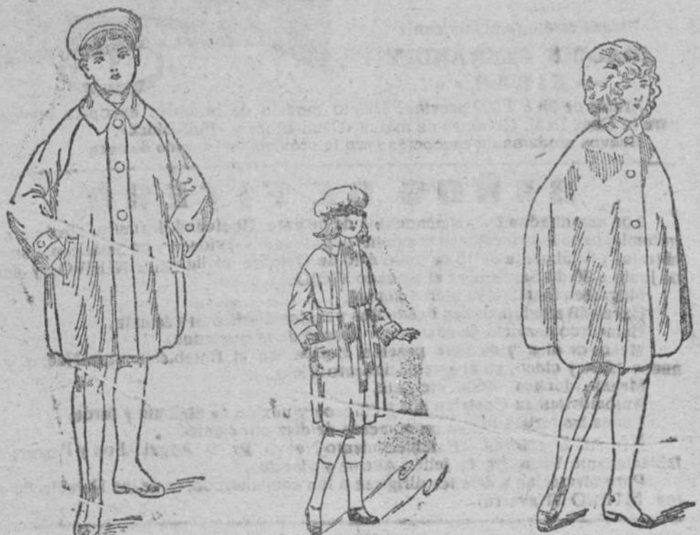
Abrigos impermeables, de niños, á 22, 25, 30 y 35 pesetas. Abrigos de paño, para niñas, á 12, 15, 18 y 20 pesetas. Capitas impermeables, de niñas, desde 12, 15, 18, 20 y 25 pesetas