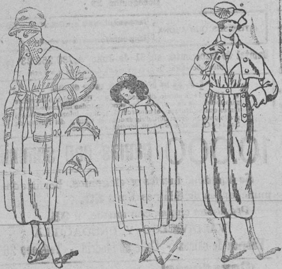
Grandes novedades en abrigos de paño, desde 50 á 175 pesetas. Capas novedad, desde 60 á 130 pesetas

Gran bazar de ropas confeccionadas de caballero, señora y niñas