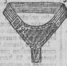
Ligas, a 0'50