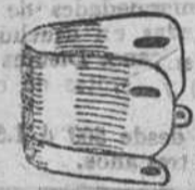
Puños piqué, a 1'50 y 1'75