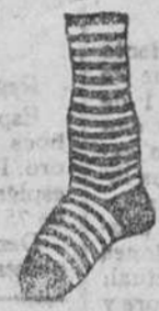
Calcetines finos, listas, novedad, a 1'25 y 1'50