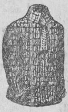
Jerseys de caballero a 4, 5, 6 y 7 pesetas