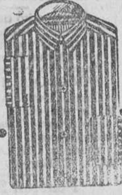
Camisas pechera oto-mán seda, 7, 8, 9 y 10.