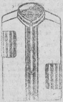
Camisas cuello pués-to, de 5 a 6 pesetas

Gran casa de tejidos, pañería y confecciones de caballero, señora y niños