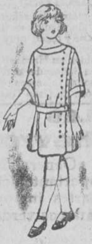
Diversidad de modelos en vestiditos de percal y batista, 2'50 a 10 pesetas.