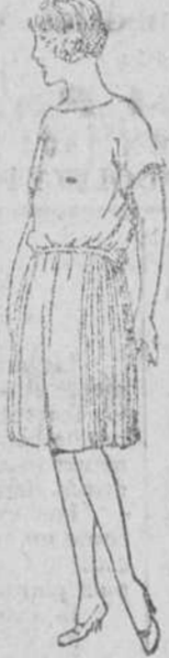
Diversidad de modelos en vestiditos de lana, de gran novedad, para niños y jovencitas.

Precio fijo verdad. Todos los artículos marcados.