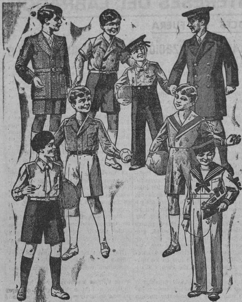
Trajecitos, modelos novedad, de 15, 18, 20, 25 y 30 pesetas La Casa que más surtido presenta y más barato vende

Primera casa en confecciones para caballero, señora y niños Plaza Mayor, 41, Lain-Calvo, 9 y 11.—Sucursal: Plaza Mayor, 6, Burgos Teléfono, 603-R — Teléfono, 284