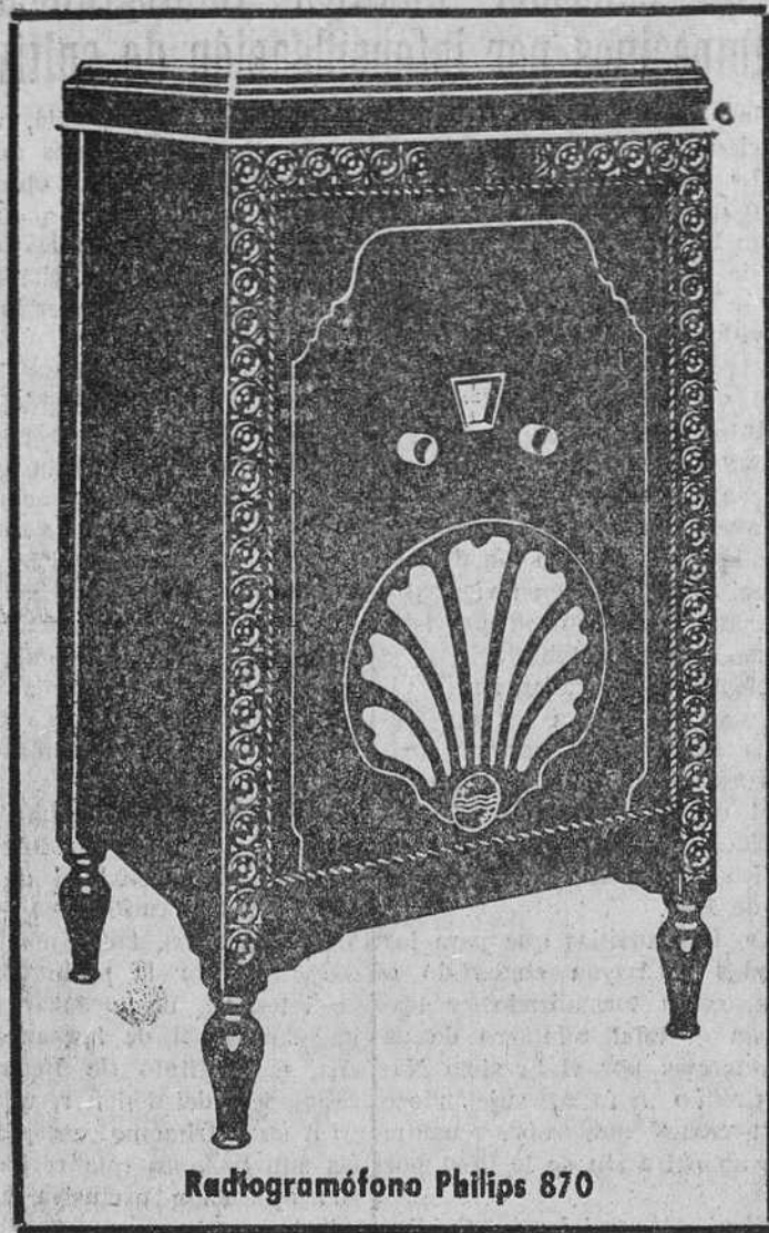
Radiogramófono Philips 870