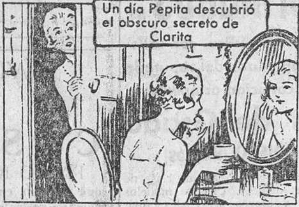
Un día Pepita descubrió el obscuro secreto de Clarita