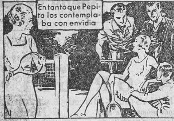
Entanto que Pepita los contemplaba con envidia