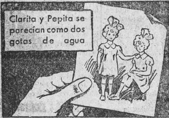
Clarita y Pepita se parecían como dos gotas de agua