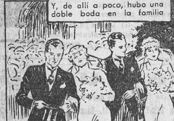
Y, de allí a poco, hubo una doble boda en la familia