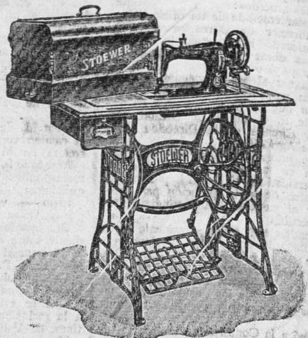
Máquina familiar, cose hacia adelante y hacia atrás, rozamiento sobre bobinas, 280 pesetas.

Siempre en depósito las piezas de recambio. — Las piezas de otras marcas valen para esta. — Máquinas al contado y a plazos.