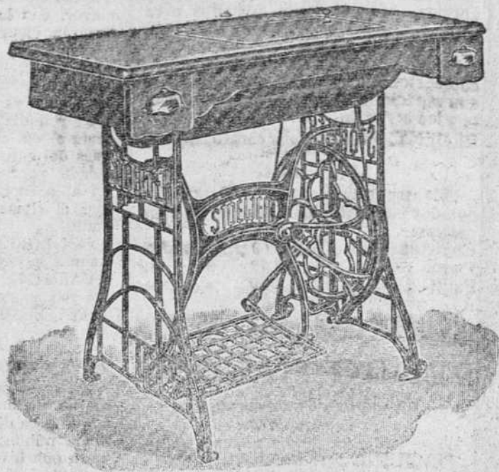
Gran modelo de máquina rotativa, a gran velocidad, para sastres, talleres de labores grandes, cuero, etc., 400 pesetas