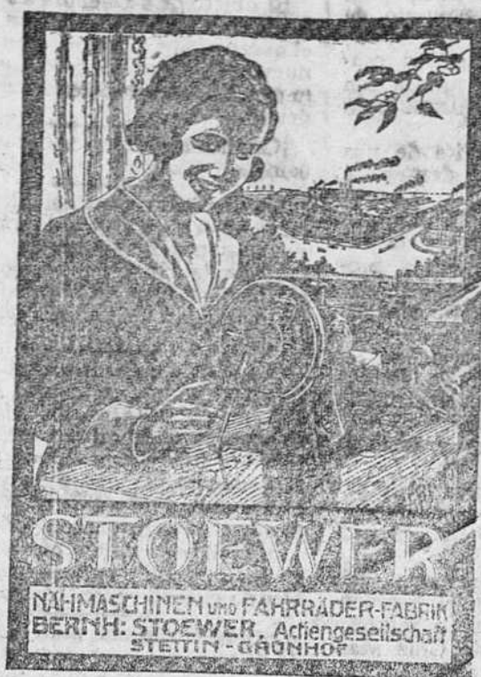
Máquina de mano, cose hacia adelante y hacia atrás, 230 pesetas.