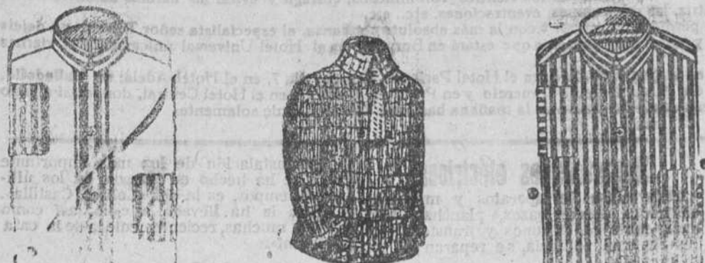
Camisas cuello puerto, de 5 a 6 pesetas

Gran casa de teleros, pañería y confecciones de caballero, señora y niños