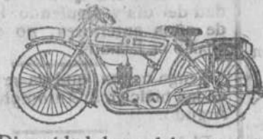
Diversidad de modelos en motos