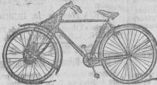
Motores para bicicletas