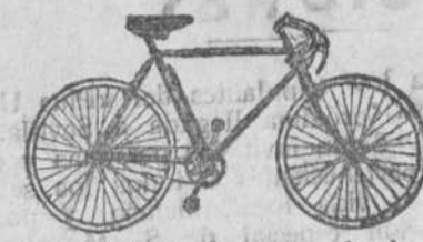
Bicicletas de paseo, desde