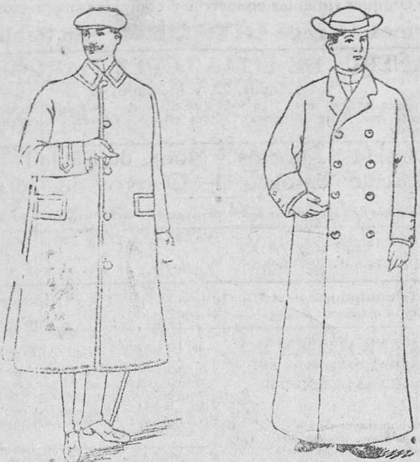
Guardapolvos de 7, 8 y 10 pesetas. Guardapolvos de satén y dril, de 15 a 25

Casa de tejidos, guarniciones y confección de esbaldos, sesteros y sábanas