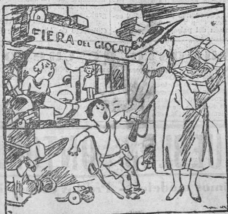
—¿Pero qué más quieres, si llevas un fusil, una pistola, un sable...? —¡Una camisa negra!

¡CUIDADO CON LAS IMITACIONES! COMPROBUE SI LE DAN HOJAS DE LA FABRICA NACIONAL DE TOLEDO. PRODUCTOS NACIONALES (S. A.) - Ap. 601 - MADRID