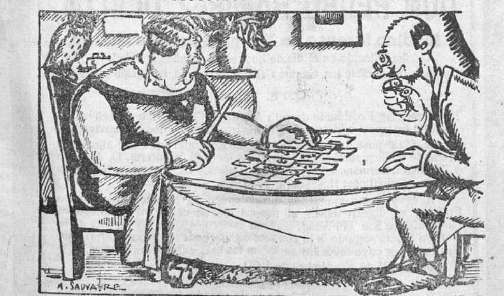
La adivinadora.—Veo un viaje... una mujer rubia abandona su hogar. El—No siga usted, es mi mujer. Cinco pesetas más si me dice usted que no volverá.