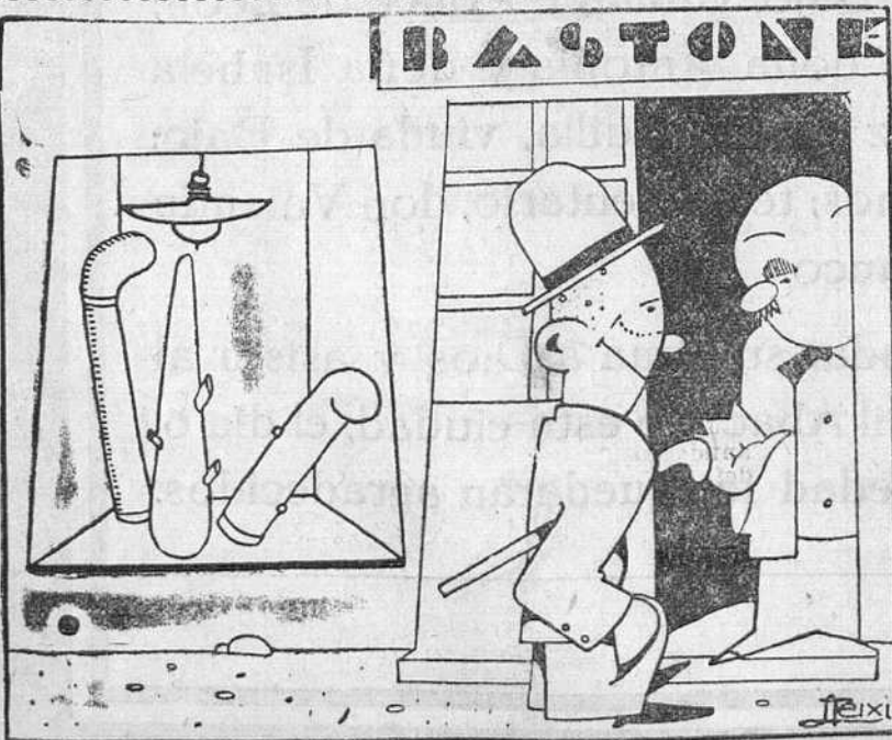
LOS GRANDES NEGOCIOS

—Acabo de poner esta tienda. ¿Qué te parece? —Te felicito. Veo que lo entiendes.