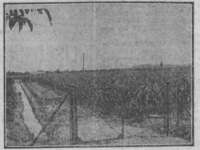
Vista parcial del campo y plantación de maíz en Aranda de Duero (Burgos)

Habiéndose dado comienzo a los ensayos para la «tournée» que la tuna burgalesa ha de efectuar estos próximos carnavales por el norte de España, se ruega a todos los aficionados que toquen algún instrumento de cuerda se sirvan pasar por «Casa Patillas», calle de la Calera, de ocho a diez de la noche, con objeto de dejar ultimada la plantilla de ejecutantes. En un día próximo daremos cuenta detallada de los planes proyectados por la mencionada tuna. Por la Comisión, Moreny.