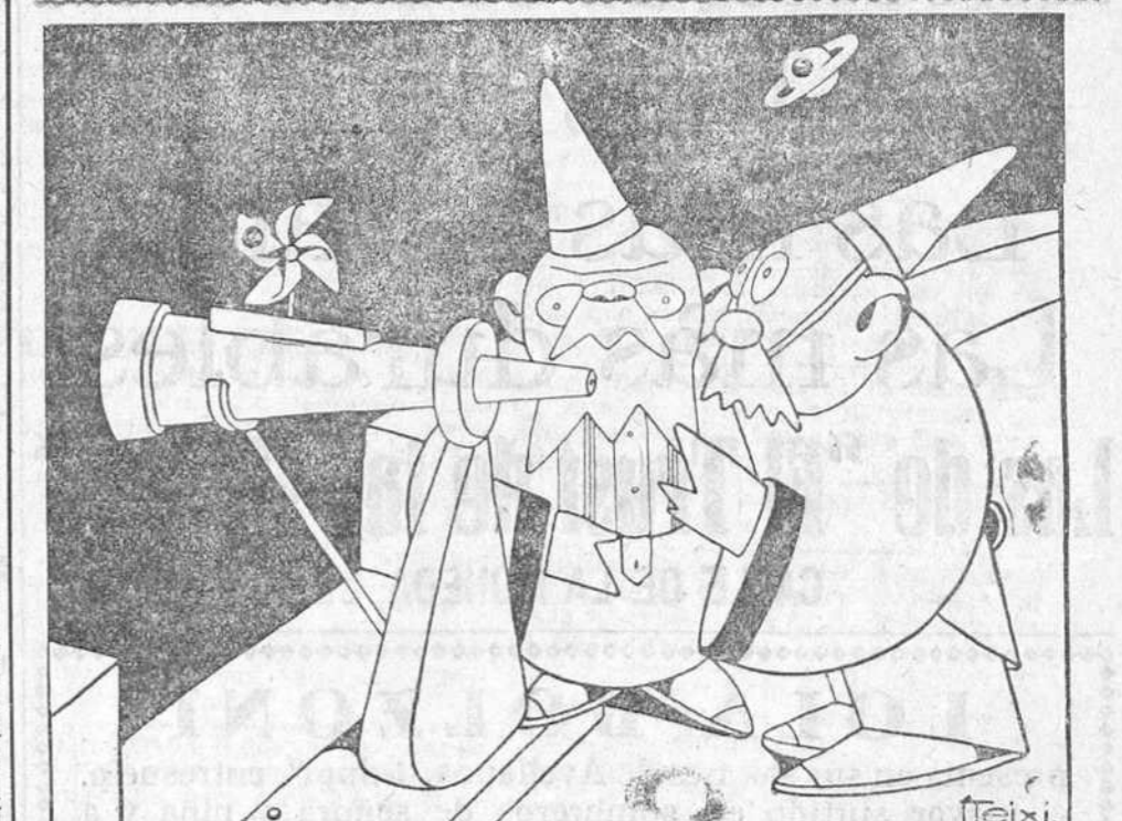
—¿Qué estás mirando con tanto afán? —A ver si encuentro por algún sitio al alcalde de Burgos.