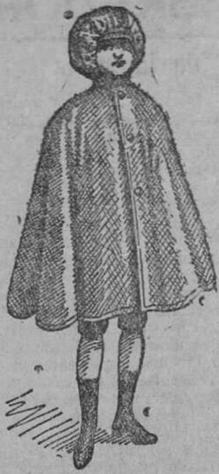
Capita impermeable a 8, 10 y 15 pesetas

Gran casa de telidos, pañería y confecciones de caballero, señora y niños