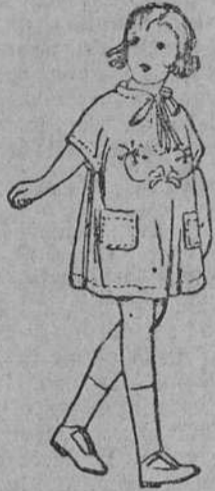
Vestiditos de niños de 3, 4 y 5 pesetas.