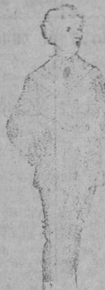
Trajecitos para niños diversidad de modelos, de 30 pesetas