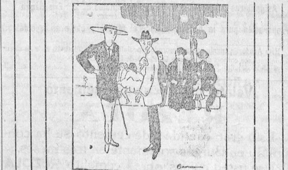
—¿De dónde gastas la ropa? —De casa de Regú ez. ¿Y tú? —Yo... de los codos.