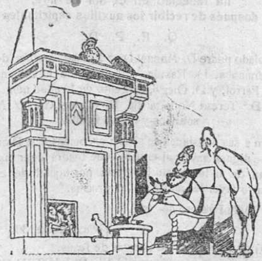
GALANTERIA DE ANCIANOS

Se da cuenta por el excelentísimo señor comisario regio de otros asuntos de trámite y se levanta la sesión.