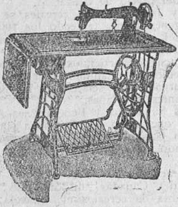
Máquina doméstica, ala de extensión, 365 pesetas.