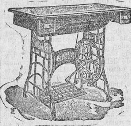
Máquina secreter, de lanzadera vibrante, 325 pesetas; de bobina central, 305.

La máquina de fama mundial y la más barata, por no tener esta casa presupuesto de gastos. Enseñanza a coser y bordar y entrega de patrones para confeccionar ropas de caballero, señora y niños.