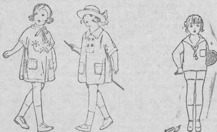
Vestiditos de niños de 3, 4 y 5 pesetas, Trajecitos de punto a 7, 8, 10 y 15 pesetas

Precio fijo verdad. Todos los artículos marcados.