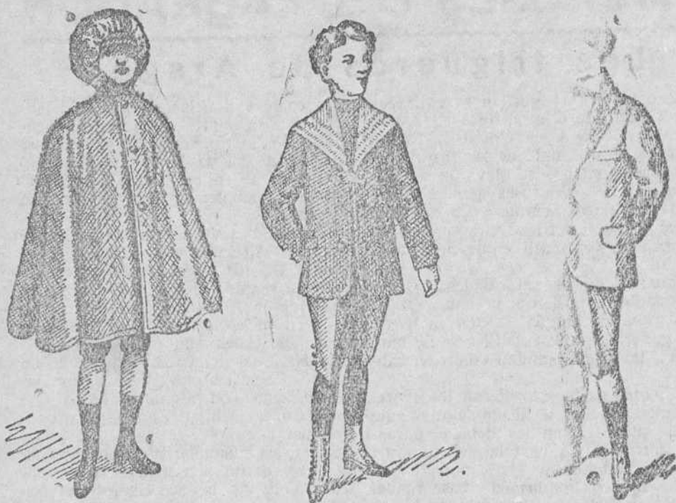
Capita impermeable a 8, 10 y 15 pesetas Trajecitos para niños diversidad de modelos, de 30 pesetas

Gran casa de tejidos, pañería y confecciones de caballero, señora y niños