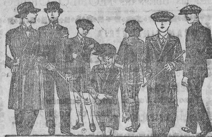
TRAJES para mocetes todos los gustos, edad de 10 a 16 años a 30, 40, 50 60 y 70 pesetas. TRAJES, pantalón novel, desde 35 a 75 pesetas.

La casa que más barato vende y más surtido presenta