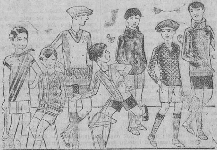
Jerseys punto, para niño, diversidad de dibujos y colores A 4 5, 6, 7, 8 y 10 pesetas