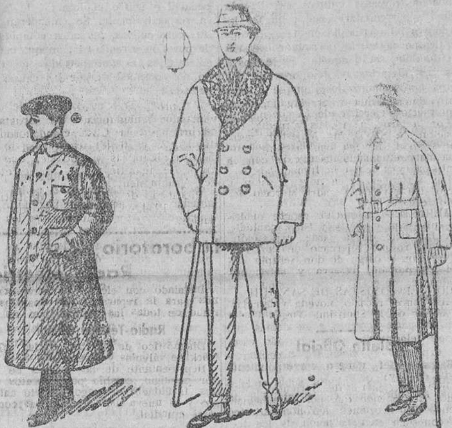
Guardapolvos de caballero a 8-10, 12 y 15 pesetas Peñizas paño, cuello rizo a 18, 20, 25, 30, 40, 50 y 75 pesetas Gabardinas a 40, 50, 60 y 70 pesetas Impermeables de 25 a 30