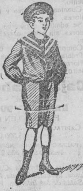
50 modelos diferentes en trajes de niños, en dril, paño y pana.