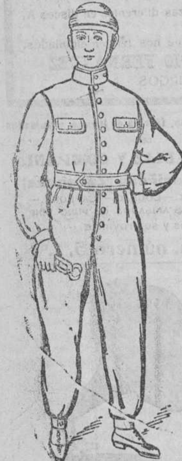
Traje guerrera y pantalón unidos, en dril azul y negro, impermeabilizados, de 14 á 30 pts.

Espléndido surtido en prendas sueltas para toda clase de trajes de caballero y niños