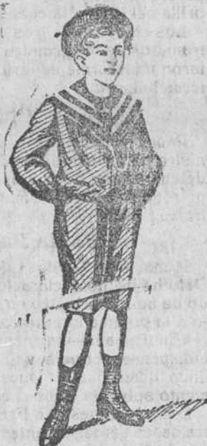
50 modelos diferentes en trajes de niños, en dril, paño y pana.

Visiten esta casa y se convencerán de los grandes surtidos que presenta en abrigos gabardina, trajes dril (caballero) y guardapolvos (caballero, señora y niños).