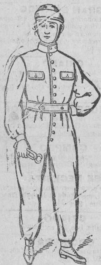
Traje guerrero y pantalón unidos, en dril azul y negro, impermeabilizados, de 14 á 30 pts.

REPRESENTANTE EXCLUSIVO DE LAS MEJORES FÁBRICAS DE ESPAÑA