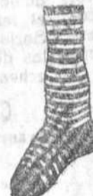
Calcetines lana a 1.25, 1.50 y 2 pesetas. En algodón a 0.55, 0.70, 0.80, 0.90 y 1 peseta.