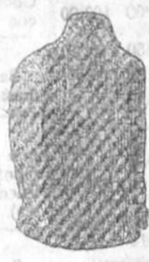
Jersey lana, con corbata a 14, 16, 18 y 20 pesetas. En algodón a 6 y 7 pesetas.