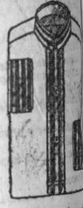
Camisas percal, color y puños dobles a 7 y 7.50 pesetas.