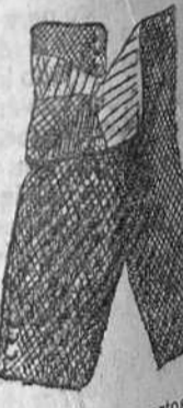
Pantalones cortos, de pana y vicuña a 4.50, 5 y 6 pesetas.