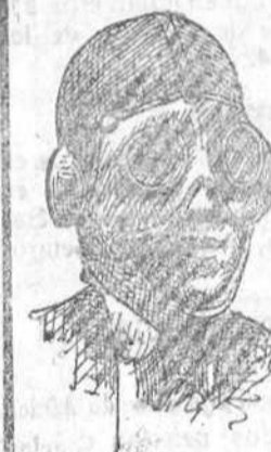
Pasamontañas lana a 3.50 pesetas. Gafas a 5 pesetas.