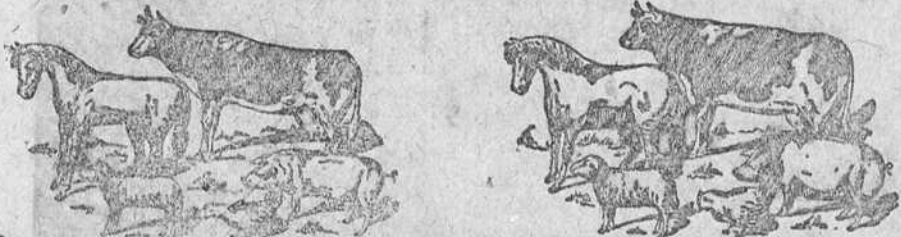
Antes de tomar El Engorde Castellano de Liras, hay ganado anémico, sin apetito, hace malas digestiones, enferman.