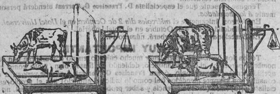
Demonstración del resultado de este preparado.

Las gallinas ponen doble número de huevos y pierden el vicio de comérselos, las evita esa enfermedad que tanto las persigue y ponen dos meses antes las jóvenes. Como en la composición de este preparado entran elementos que forzosamente tienen que resultar para este objeto y dosificados como van escrupulosamente.