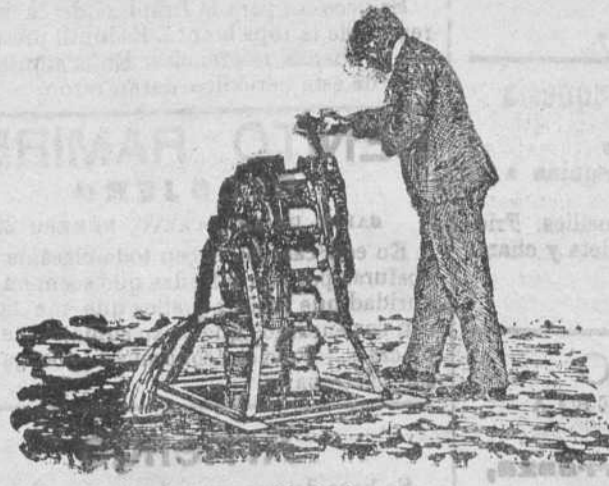
Noria de mano

RECIBOS TALONARIOS de INDICINA Una peseta e cinco