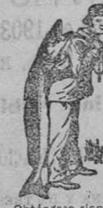
Obtengase siempre la Emulsión con esta marca "El Pescador", marca del procedimiento Scott.

en la envoltura garantiza los mejores ingredientes, la elaboración mas hábil y por consiguiente los efectos mucho mas energicos, que en ninguna otra emulsión; ventajas que valen mucho más, que el pequeño aumento en el precio que exigen. En todas las farmacias. Empiece hoy! D. Carlos Marés, Calle de Valencia No. 333, Barcelona, envía muestra gratis al que remita 75 cts. en sellos para el franqueo.