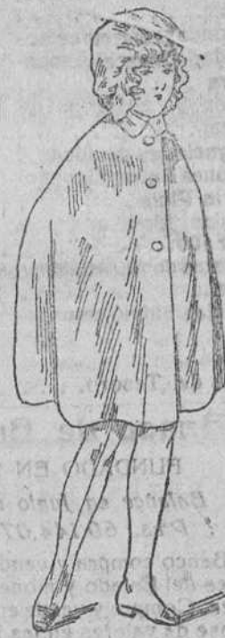
Capotes impermeables, á 10, 12, 15, 20 y 30 pts.

Plaza Mayor, 42, y Lala-Calvo, 9. Teléfono núm. 88. Burgos PRIMERA CASA EN CONFECCIONES