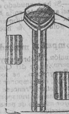
Camisas percal, á 8, 9 y 10 pesetas.

Depósito de las sandalias «Pacos», con piso de goma, propias para invierno, y de las máquinas de escribir NOISELESS, completamente silenciosas.