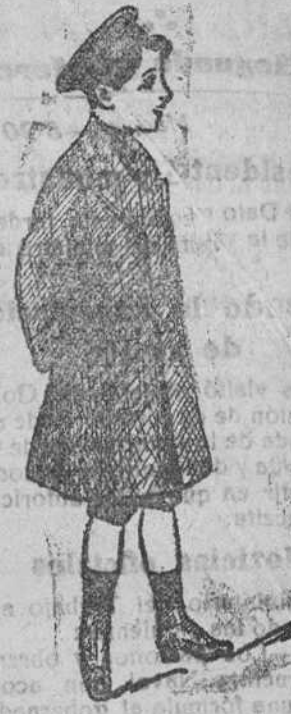
Gabón de paño melton á 25, 30, 40 y 50 pts.