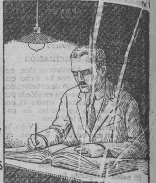
TRABAJANDO con PHILIPS ARGÁ LLENA DE GAS ARGON

Es inútil ocultar la verdad. Las modernas lámparas PHILIPS-ARGÁ sustituirán en breve plazo las de filamento metálico, que ya no convienen.