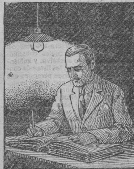
TRABAJANDO CON LAMPARA DE FILAMENTO METÁLICO