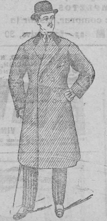
Gobardinas caballero, a 100, 115, 140 y 150 pesetas.

Plaza Mayor, 42 y Lain Calvo, 9 — BURGOS —