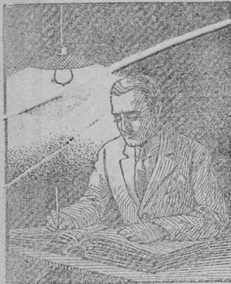
TRABAJANDO CON LÁMPARA DE FILAMENTO METÁLICO