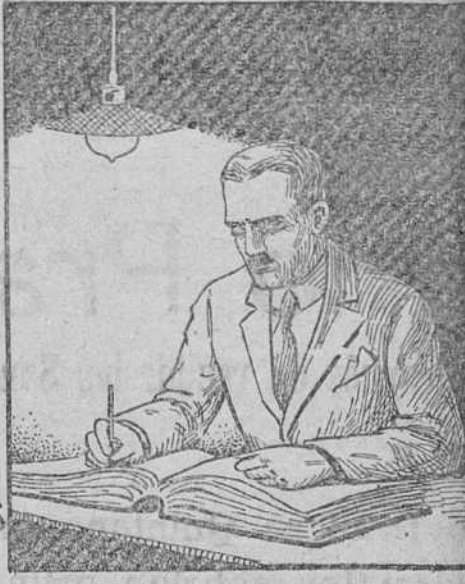
TRABAJANDO con "PHILIPS ARGA" LLENA DE GAS ARGÓN.

Es inútil ocultar la verdad. Las modernas lámparas PHILIPS-ARGA sustituirán en breve plazo las de filamento metálico, que ya no convienen.