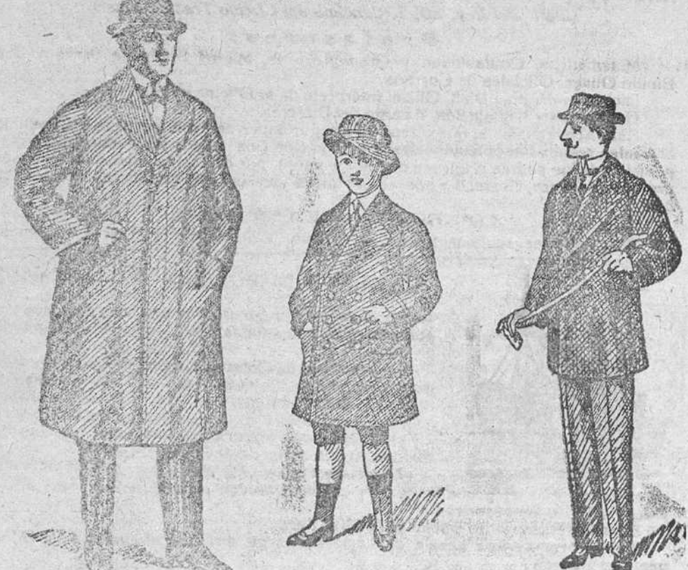
Gabanes de caballero y jóvenes, desde 40 a 125 pesetas. Siempre últimas novedades. Gabanes para juveniles, desde 25, 30, 35, 40 y 50 pesetas. Pellizas desde 18 a 75 pesetas. Grandes surtidos