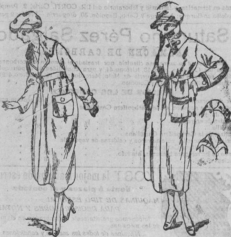
Dos nuevos modelos en Impermeables de señora, en negro y color, desde 35, 40, 50, 60 y 75 pesetas.

Plaza Mayor, 42, y Lain-Calvo, 9.-Teléfono núm. 88.-Burgos